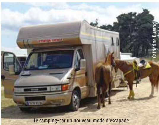
Le camping-car un nouveau mode d'escapade